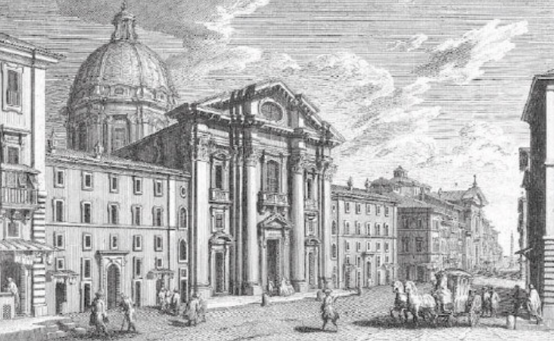
San Carlo al Corso, radering av Giuseppe Vasi 1710–1782.