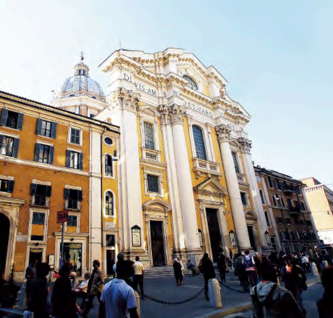
Kirken San Carlo al Corso, med sin mektige tempelfront mot Romas hovedgate Via del Corso. Forside: St. Olavsalteret i San Carlo al Corso, Roma, malt av Pius Welonski, innviet 1893.